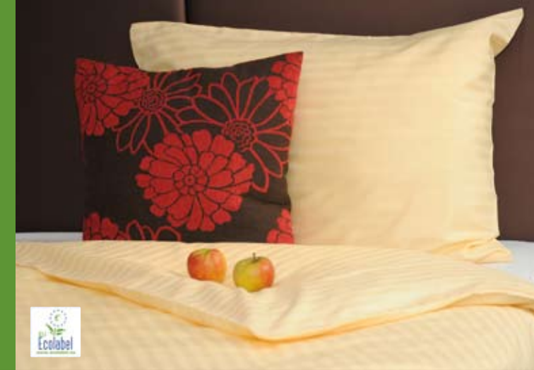
Bettwäsche in verschiedenen Farben ausgezeichnet mit dem EU Ecolabel